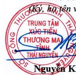
Nguyễn Khánh Toàn