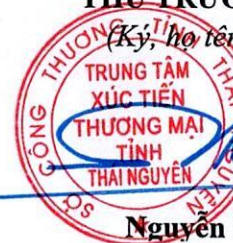
Nguyễn Khánh Toàn